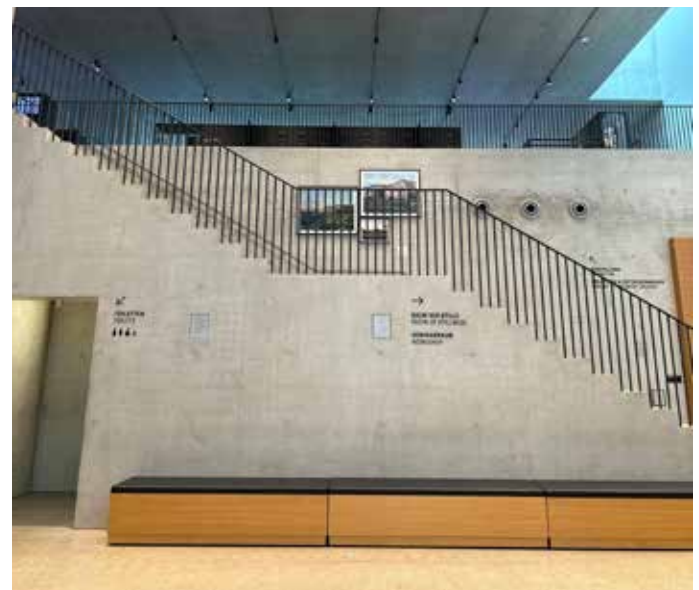
Eingangstür und Eingangshalle des Dokumentationszentrums