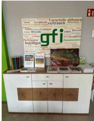
Ausstellung unserer Vereinsliteratur, heute in geschmälerter Ausführung