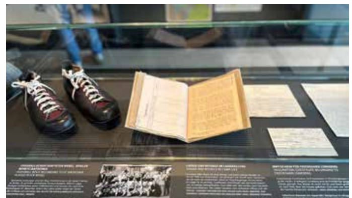
Andenken aus dem Lageralltag

Hier wird nichts beschönigt und nichts dramatisiert. Stattdessen begegnet man persönlichen Geschichten, Tagebucheinträgen, Fotos und Zeitzeugenberichten, die zeigen, wie vielschichtig und menschlich diese Kapitel unserer Geschichte sind. Gerade für Menschen, deren Familiengeschichte eng mit diesen Ereignissen verbunden ist, entsteht ein Moment der stillen Verbundenheit.