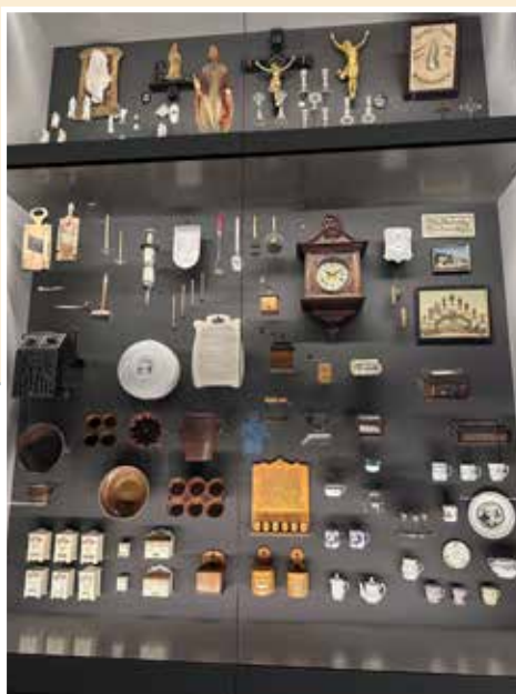
2 Vitrinen mit Erinnerungstücken aus der Heimat

Solche Objekte erzählen Geschichten, ohne ein einziges Wort zu brauchen. Sie stehen für Erinnerungen an eine alte Heimat, für das, was man nicht zurücklassen wollte — und für das, was trotz aller Not gerettet werden konnte.