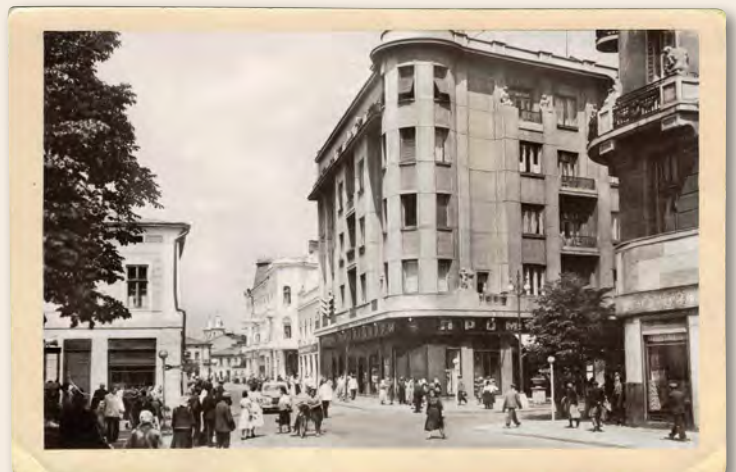
Das zweite fünftöckige Gebäude in Stanislau, 1913/14. Das erste war das Hotel und Restaurant »Union« (1912)