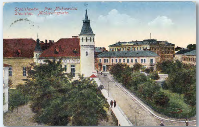
Der Mickiewicz-Platz. Gebäude mit Turm: Sitz des polnischen Turnvereins »Sokół«