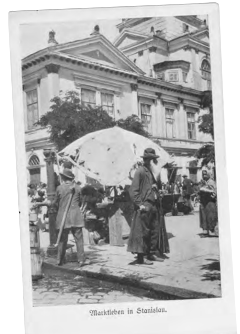
Marktleben in Stanislaw.