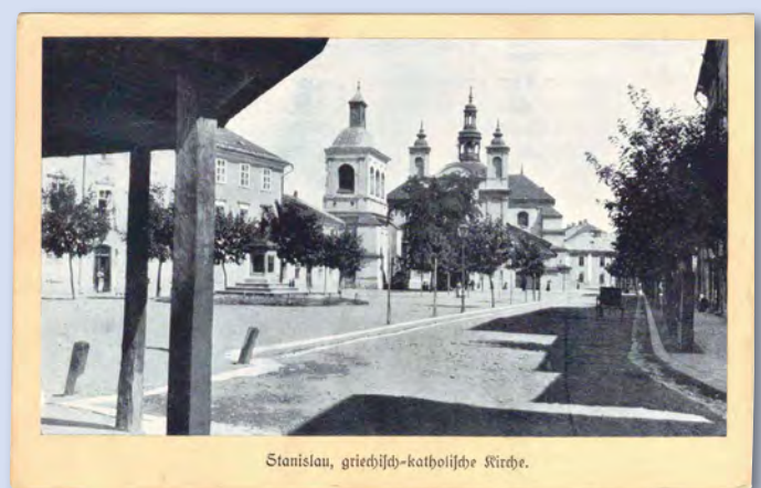
Stanislau, griechisch-katholische Kirche.