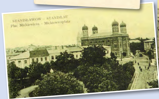
STANISLAWÓW - STANISLAW Plac Mickiewicza - Mickiewiczplatz