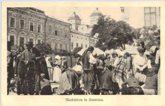
Marktleben in Stanislau.

Bäuerliches bunt-folkloristisches Marktleben vor großstädtischer Kulisse. Ähnlich bunt, vielfältig, aber gespalten war das religiöse Leben.