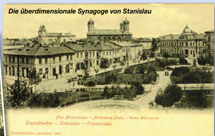
Plac Mickiewicza. - Mickiewicz-Platz. - Площ Миконовича. Stanisławów. - Stanislau. - Станиславів.