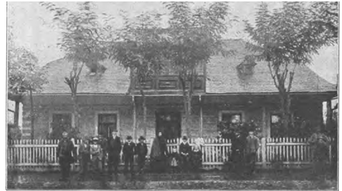
Deutsches evangelisches Kinderheim in Stanislaw (Mädchenabteilung).