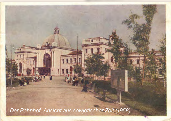
Der Bahnhof. Ansicht aus sowjetischer Zeit (1958)