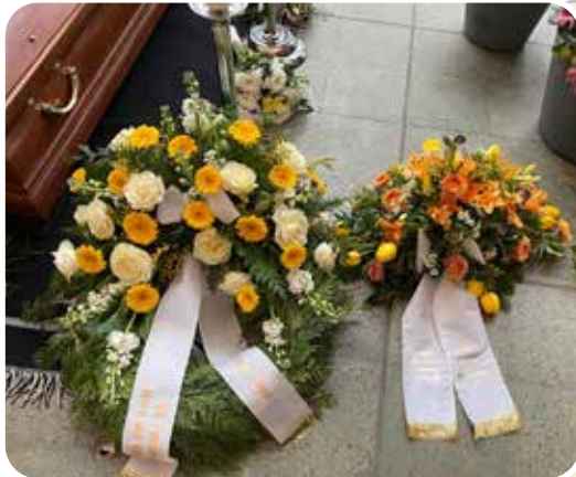
Die Trauergestecke eines Familienmitgliedes (links) und daneben der Galiziendeutschen